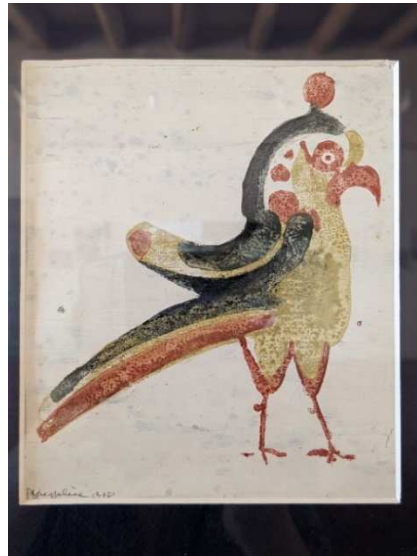
Oiseaux, de Philippe Kaepelin

L'ensemble de ces œuvres sont réparties en sept espaces thématiques :