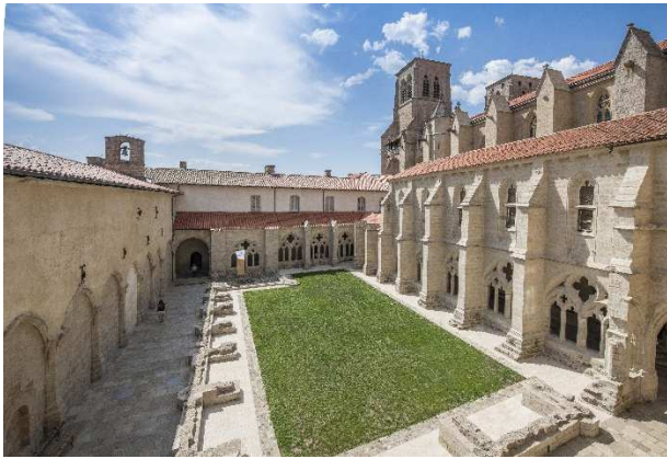
Cloître de l'abbaye

L'abbaye de La Chaise-Dieu : un ensemble patrimonial exceptionnel en Auvergne-Rhône-Alpes.