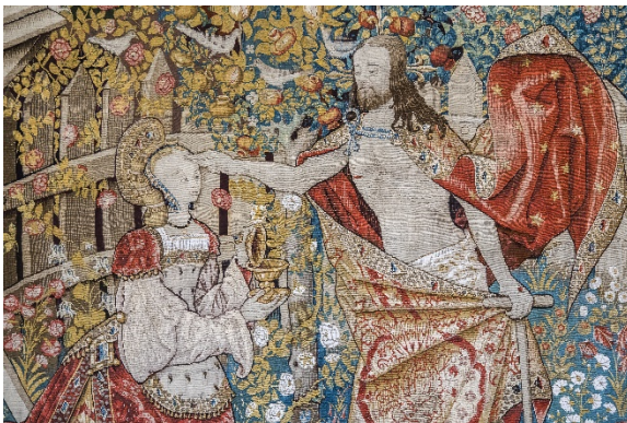
L'apparition à Marie-Madeleine