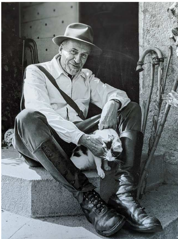
Henri Pourrat photographié par Albert Monier ©SAHP

Illustrations, peintures, sculptures, chansons, musiques, photographies, estampes, poèmes, film, etc. Toutes ces merveilles illuminent les mots d'Henri Pourrat.