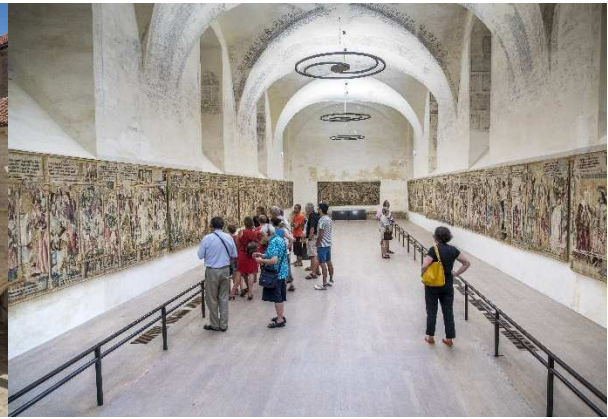
Nef des tapisseries, classées Trésor national

Fondée en 1043 par Robert de Turlande, l'abbatiale Saint-Robert et l'abbaye de La Chaise-Dieu s'inscrivent dans l'histoire religieuse, politique, économique, sociale et sanitaire, du dernier millénaire. Née d'une histoire qui dépasse, de beaucoup, les simples frontières du département de la Haute-Loire, l'abbaye de La Chaise-Dieu, trésor vénéré, devient une charge très lourde pour la commune de 700 âmes qui en est propriétaire.