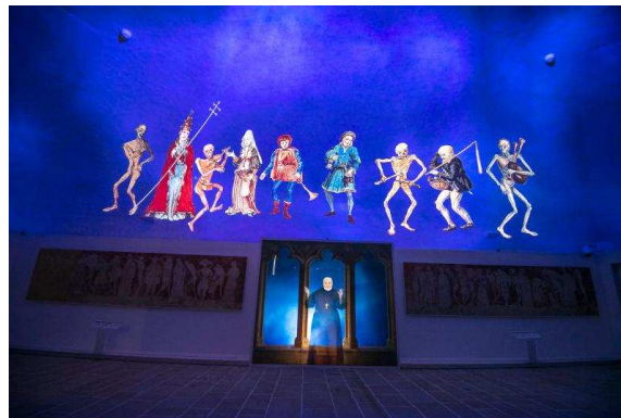
Fac-similé de la danse macabre