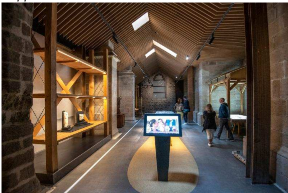
Historial des bâtisseurs