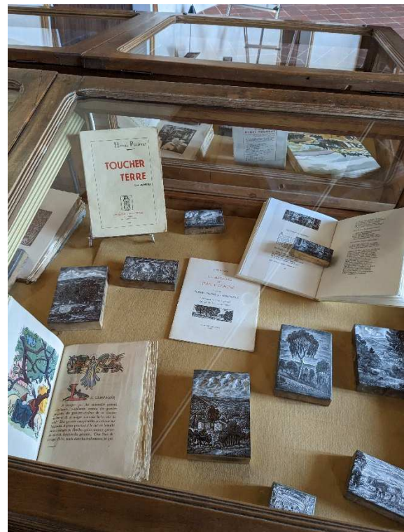
Bois gravés par François Angeli et illustrations de livres d'Henri Pourrat