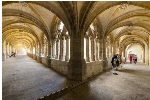
Cloître, double travée