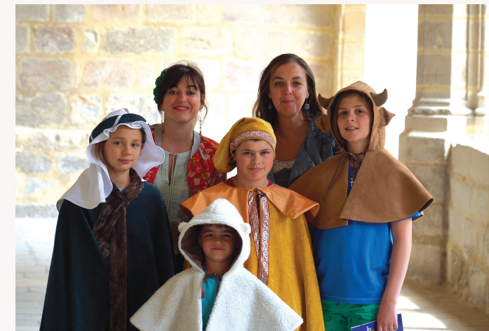
Visitez costumés !