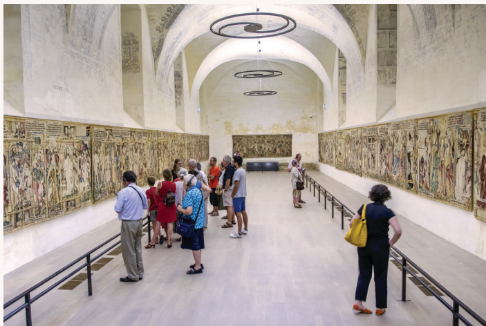
Découvrez l'extraordinaire Nef des tapisseries

Avec un audio guide ou en visite guidée, du 30 mars au 3 novembre 2024