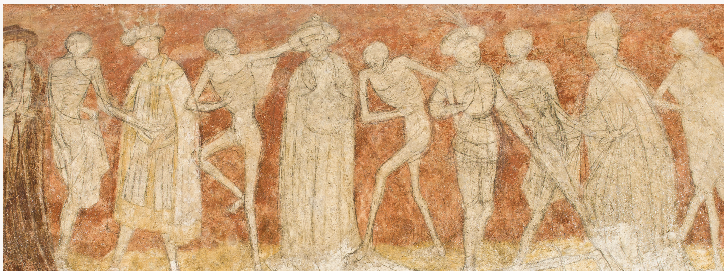
Admirez l'étonnante peinture murale de la danse macabre

À découvrir pendant votre visite : le cloître, la nef des tapisseries, la célèbre salle de l'Écho, la peinture murale de la danse macabre et bien d'autres trésors.