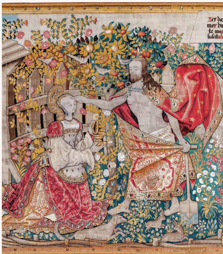
Apparition du Christ à Marie-Madeleine (détails)

Une scénographie immersive plonge les visiteurs à travers 1000 ans d'histoire. Les 14 tapisseries flamandes, classées trésor national, sont exposées dans des conditions uniques de mise en lumière et de proximité, au sein d'un écrin architectural remarquable.