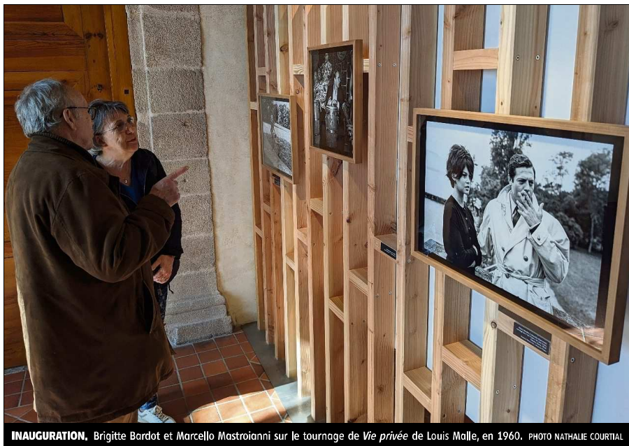
INAUGURATION. Brigitte Bardot et Marcello Mastroianni sur le tournage de Vie privée de Louis Malle, en 1960.

Plusieurs thématiques retracent la carrière du photographe français, à commencer par le photoreportage. Trente-deux photographies reviennent sur la période de la commande pour différentes agences, où l'on découvre aussi bien des stars telles que Brigitte Bardot,