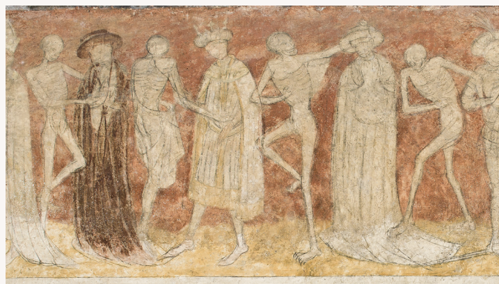
Admirez l'étonnante peinture murale de la Danse macabre

Une scénographie immersive plonge les visiteurs à travers 1000 ans d'histoire. Les 14 tapisseries flamandes, classées trésor national, sont exposées dans des conditions uniques de mise en lumière et de proximité, au sein d'un écrin architectural remarquable.