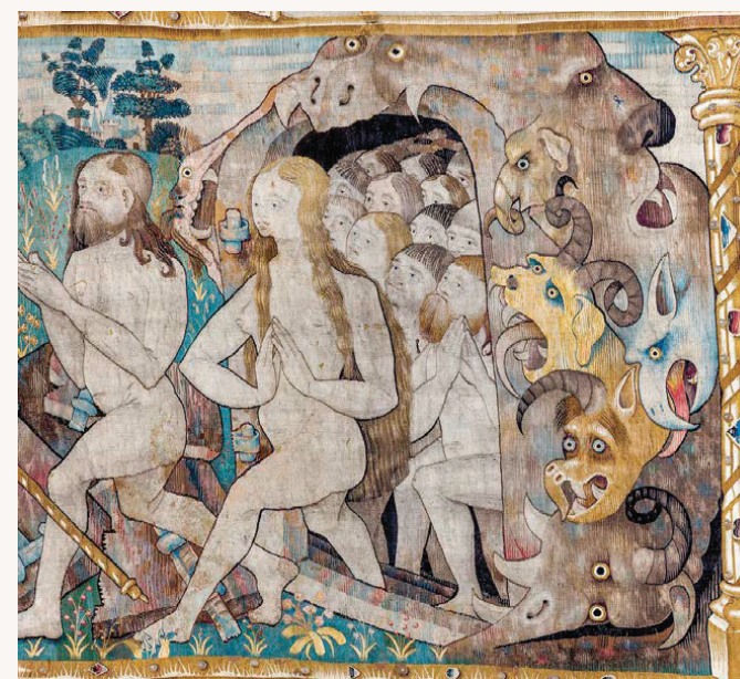
Contemplez les 14 tapisseries flamandes, Trésor national