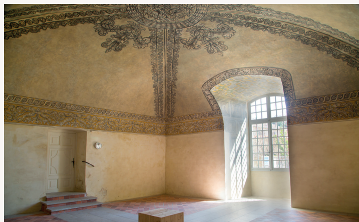
Testez la surprenante acoustique de la salle de l'Écho