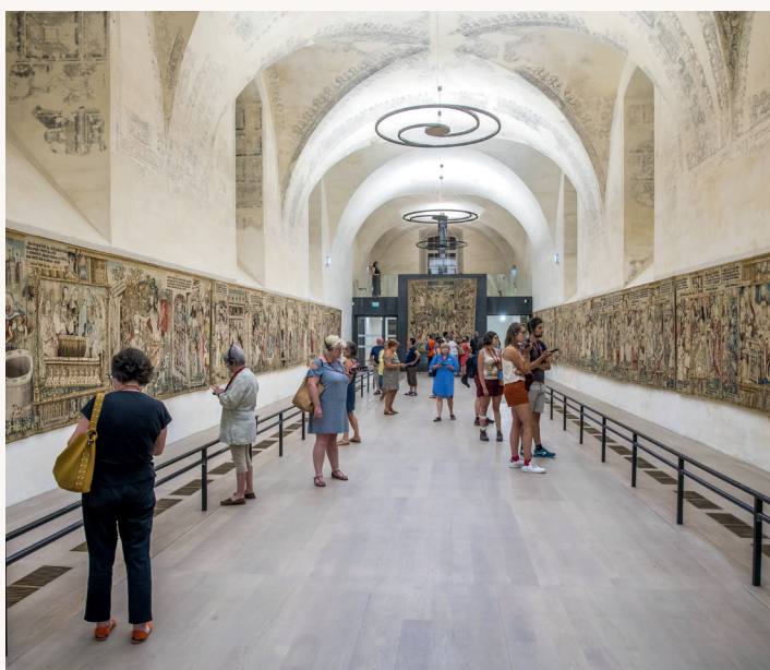
Découvrez l'extraordinaire Nef des tapisseries