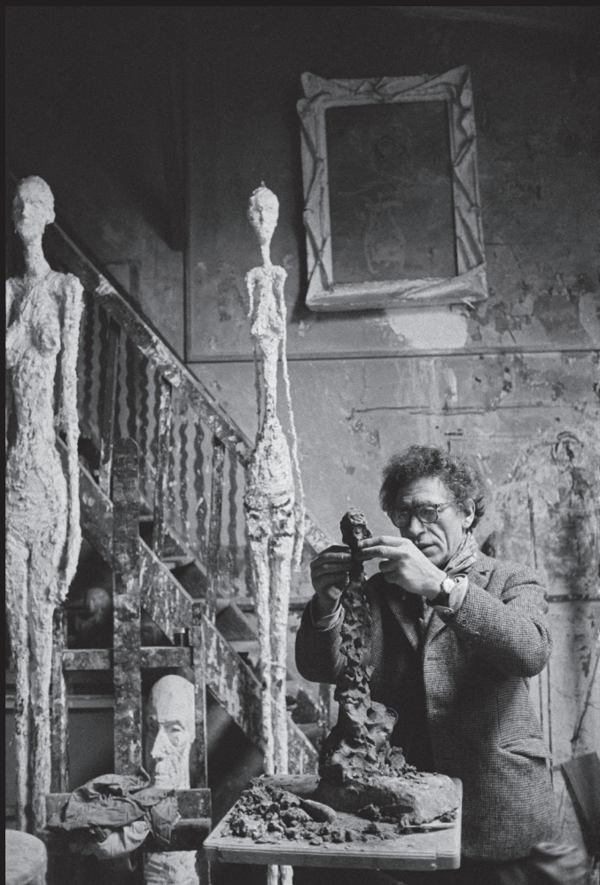
Alberto Giacometti, peintre et sculpteur suisse, dans son atelier rue Hippolyte Maindron, Paris, France, 1960