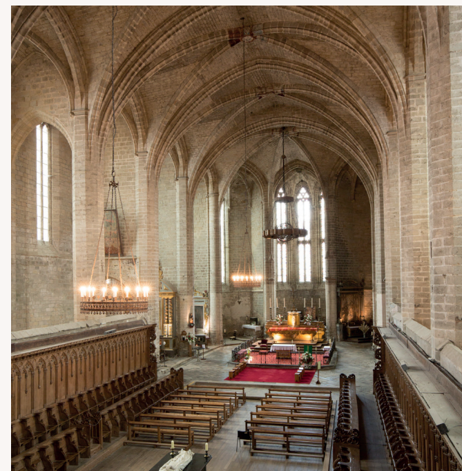
Profitez de la grandeur des lieux