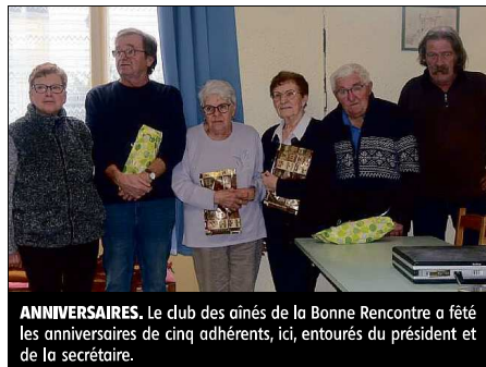
ANNIVERSAIRES. Le club des aînés de La Bonne Rencontre a fêté les anniversaires de cinq adhérents, ici, entourés du président et de la secrétaire.

Le club de La bonne rencontre a dressé son bilan annuel